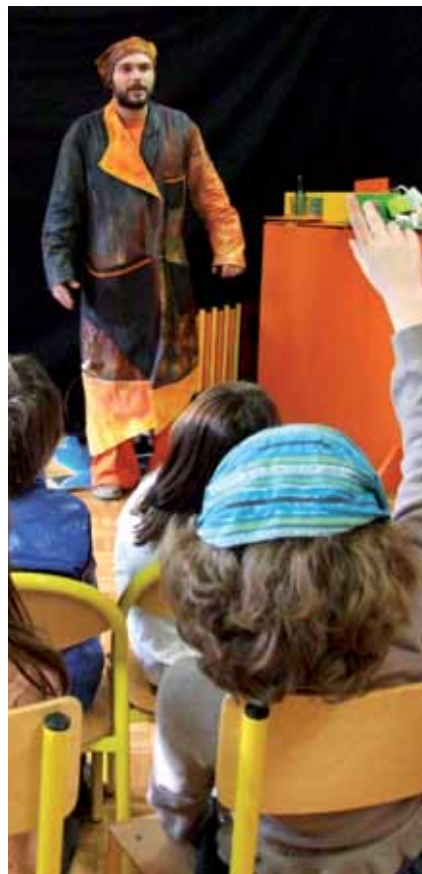
Animation sur le tri sélectif dans les écoles