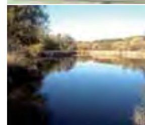
L'habitat, les déplacements, l'économie et l'environnement constituent les enjeux majeurs du SCoT.