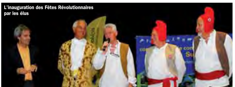
L'inauguration des Fêtes Révolutionnaires par les élus