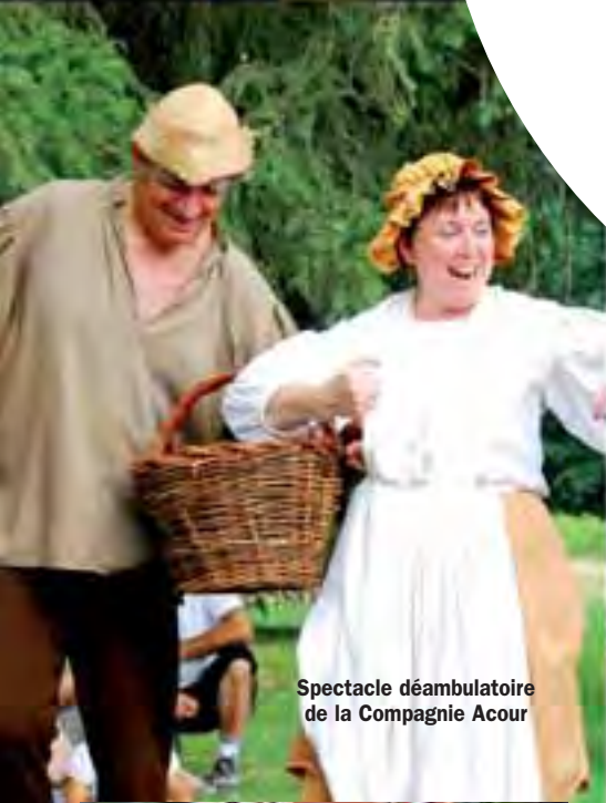
Spectacle déambulatoire de la Compagnie Acour

Le Sud Grenoblois était en liesse du 21 au 25 juillet à l'occasion des Fêtes Révolutionnaires de Vizille qui ont pris une ampleur exceptionnelle avec la présence simultanée de la manifestation nationale équestre Equirando .