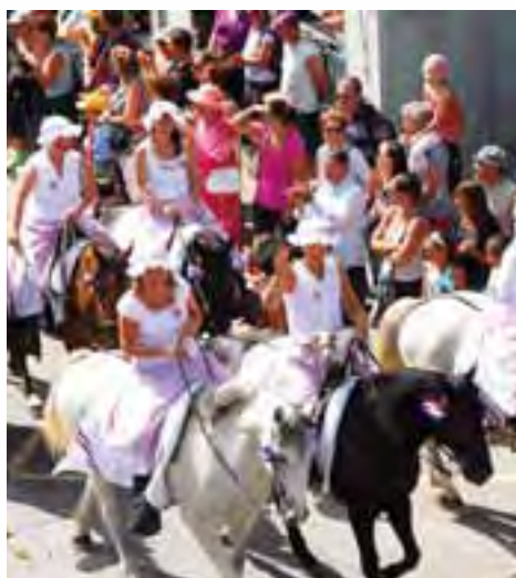
Le grand défilé d'Equirando aux couleurs tricolores

Nous vous donnons d'ores et déjà rendez-vous pour l'édition 2011 des Fêtes Révolutionnaires, du mercredi 21 au dimanche 24 juillet !