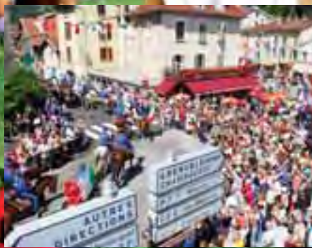
Du monde dans les rues de Vizille