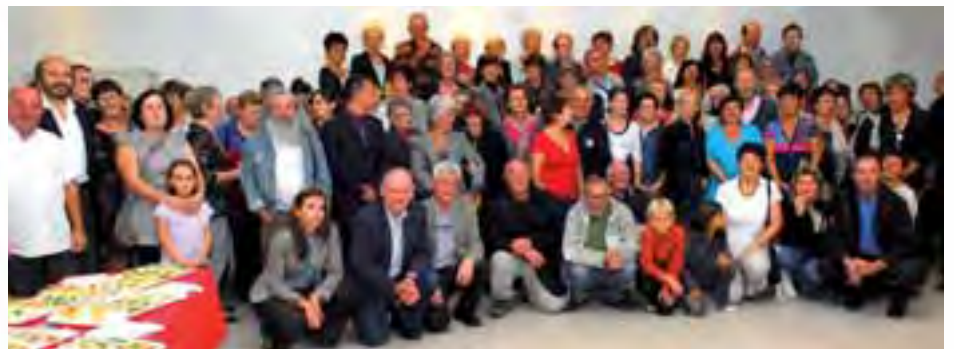
Les retrouvailles des bénévoles lors de la soirée du 6 octobre