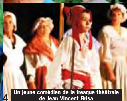
Un jeune comédien de la fresque théâtrale de Jean Vincent Brisa