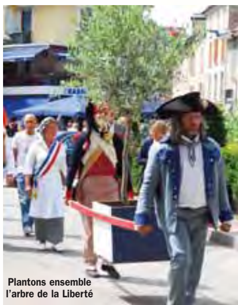
Plantons ensemble l'arbre de la Liberté

Un public estimé à plus de 60 000 personnes a eu l'occasion de participer aux multiples animations proposées : feu d'artifice, fresque théâtrale RÈvolution, défilé équestre costumé, spectacles divers, animations de rue... Un succès indéniable rendu possible grâce à l'engagement des organisateurs, la participation des associations du territoire et de nombreux bénévoles.