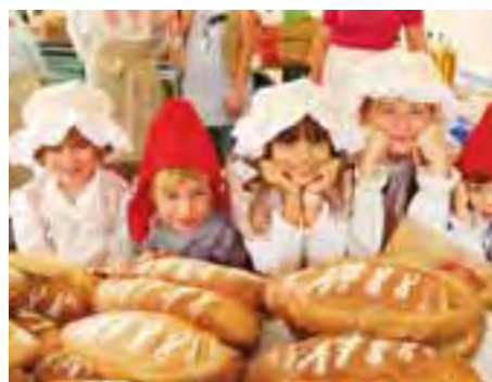
Les petits révolutionnaires