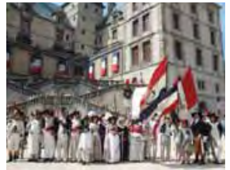
Troupes de reconstituteurs devant le Domaine Départemental de Vizille