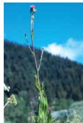
Cirse de Montpellier